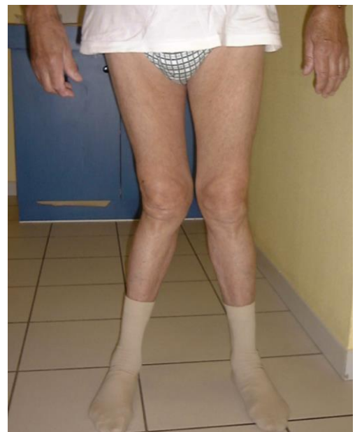
Membres en valgus